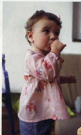
Boven: favoriet Petit Bateau.