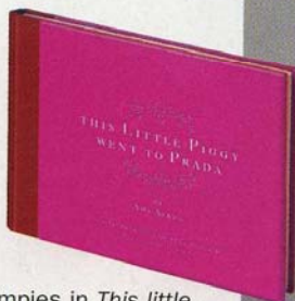
Rijmpjes in This little piggy went to Prada .