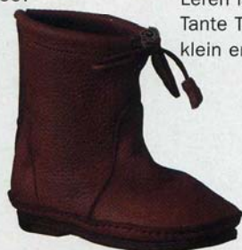
Leren laarzen bij Tante Tini. In klein en groot.