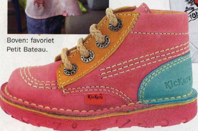
Ze zijn terug! via www.kickers.be , € 69.